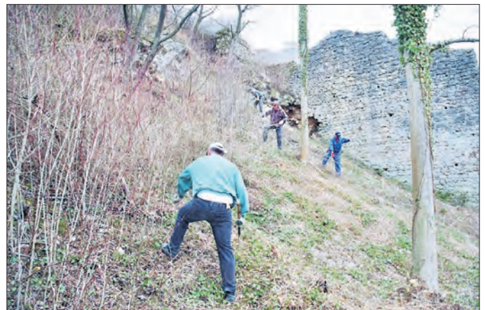
Arbeitseinsatz auf der Brandenburg