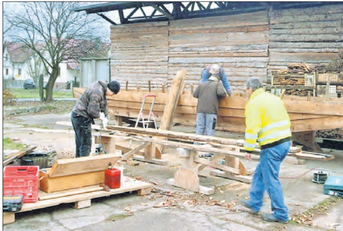
Bau des Werraprahms Dörfer in Aktion 1