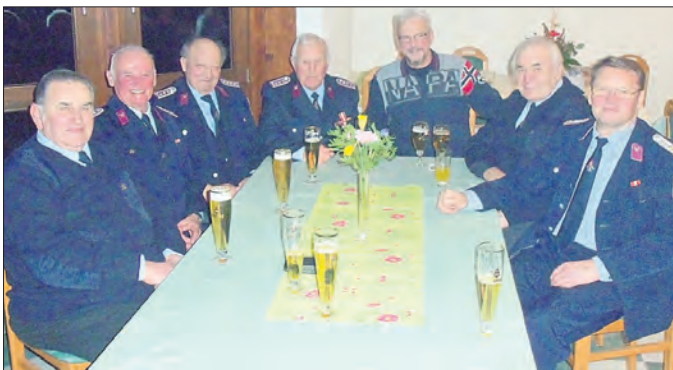
Alters- und Ehrenabteilung der FFW Untersuhl