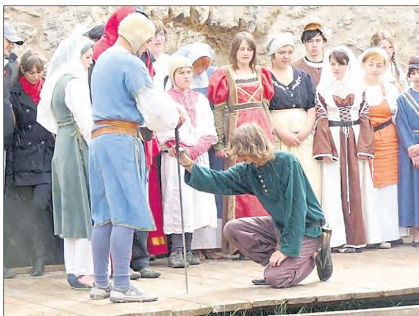
Theater auf der Brandenburg 1